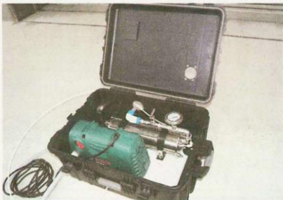
小型の海水淡水化装置「E-40H」の内部。逆浸透膜（RO）ユニットと電動の加圧機が納められている