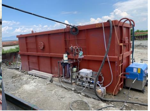
潜水士の簡易シャワー用として